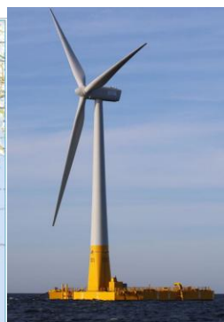
Gabarit officiel de la zone depuis Belle-Ile/Port Coton