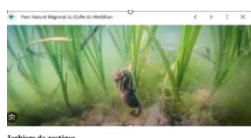
Herbiers de zostères