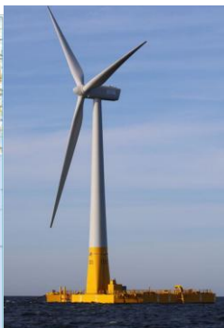
Gabarit officiel de la zone depuis Belle-Ile/Port Coton